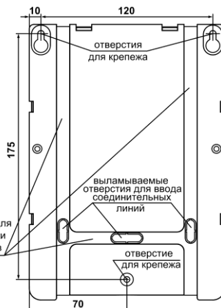
Рис.2 Основание. Присоединительные размеры

При установке АС на высоте и её дальнейшем обслуживании необходимо соблюдать правила техники безопасности при работе на высоте. Не реже одного раза в год осуществлять внешний осмотр АС и проверять качество подсоединения выводов к управляющему устройству.