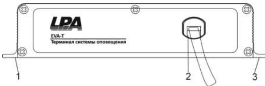
Рис. 3.2. Лицевая панель датчика неисправности LPA-EVA-T

На Рис. 3.2 представлен внешний вид лицевой датчика неисправности LPA-EVA-T.