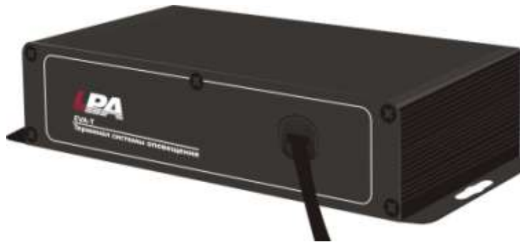
Рис. 3.1. Внешний вид датчика неисправности LPA-EVA-T

Датчик неисправности линий громкоговорителей предназначен для совместной работы с коммутаторами LPA-EVA-MS и зональными усилителями LPA-EVA-8500, позволяя определить рабочее состояние подключённых к ним цепей громкоговорителей. На работу датчика не влияют аудиосигналы фоновой музыки, ему не требуется внешнее питание, он прост в установке. Внешний вид датчика LPA-EVA-T показан на Рис. 3.1.